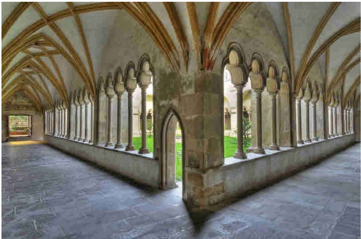
Der Kreuzgang im Franziskanerkloster von Bozen

Der Besucher eines Kirchenraumes muss gewissermaßen „mitspielen“ mit der Botschaft, die ihm der Raum und seine Elemente „zuspielen“. Das impliziert, er muss sich betref-