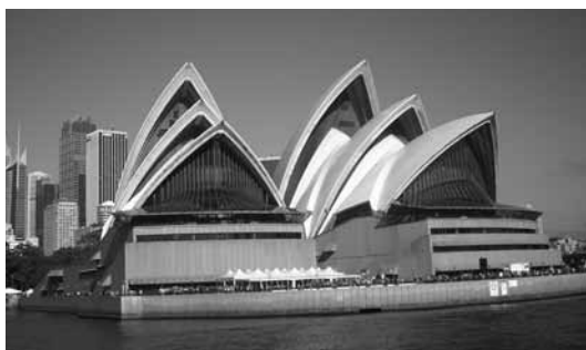
Das weltberühmte Opernhaus von Sydney

Die erste Woche verbrachten wir in der katholischen Diözese Wollongong, einer 70 km von Sydney entfernten Stadt, bei „host families“. Die Australier nahmen uns mit beeindruckender Gastfreundlichkeit auf. Ich bin mir nicht sicher, ob auch wir Menschen, die von weit her kommen, ähnlich freundlich begegnen.