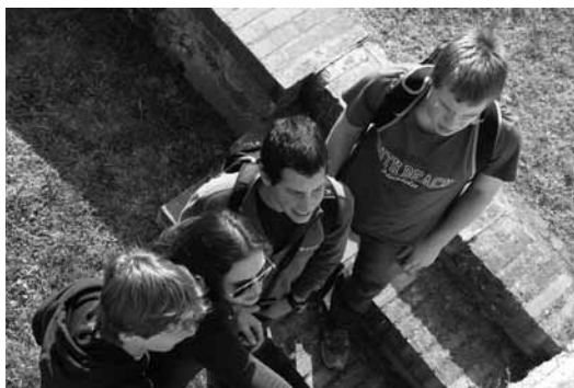
Schüler versuchen eine mittelalterliche lateinische Inschrift in Possagno zu entziffern