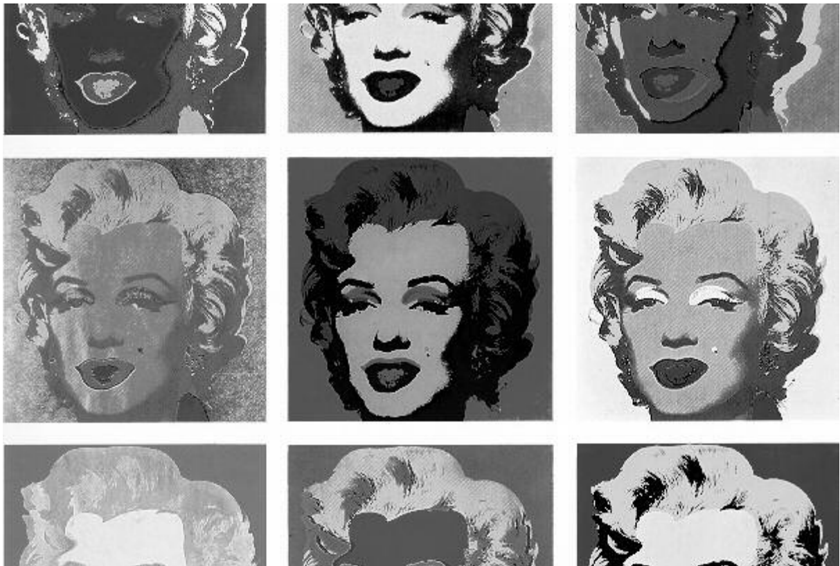
Andy Warhol, Marilyn