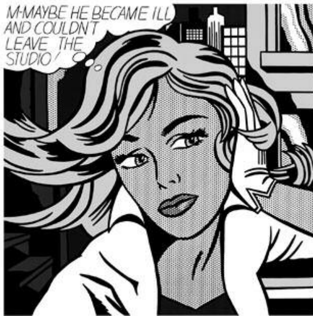
Roy Lichtenstein, Maybe