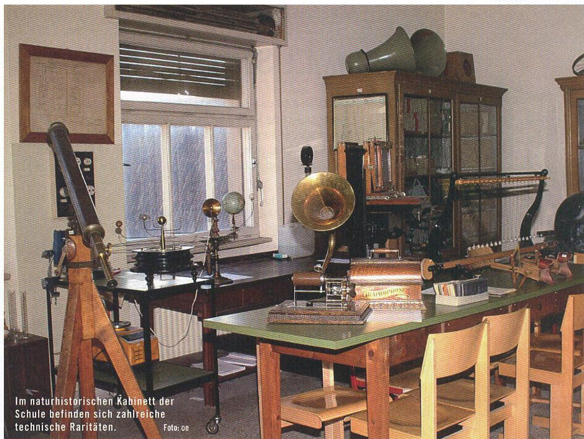
Im naturhistorischen Kabinett der Schule befinden sich zahlreiche technische Raritäten.